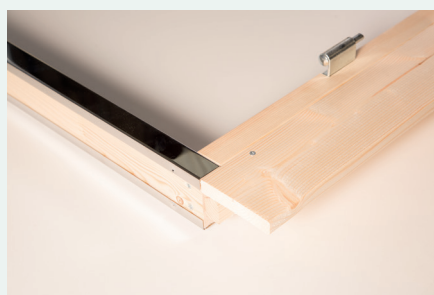
8. Seitenblende unterkante Türschwelle bündig