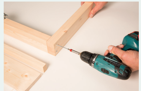
3. Türrahmen verschrauben