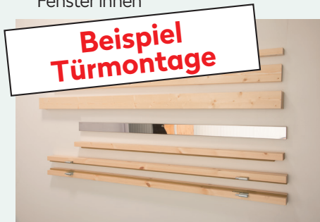
1. Türrahmen mit Leisten 3 x 28-70 mm und 6 Blenden