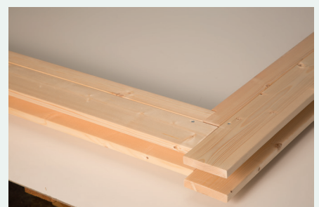
9. Ansicht fertig montierter Rahmen oben rechts