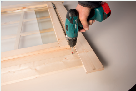
4. Fertig montierte Blenden, Fenster innen