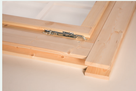
5. Ansicht fertig montierter Rahmen oben rechts, Blende innen u. außen