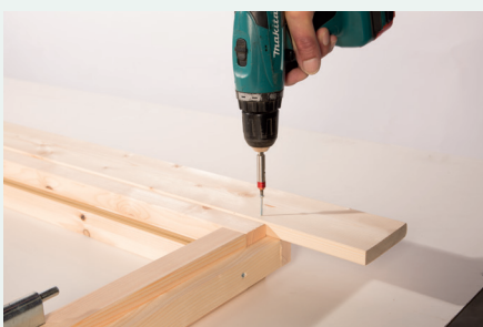
7. Anschrauben der Blende oben