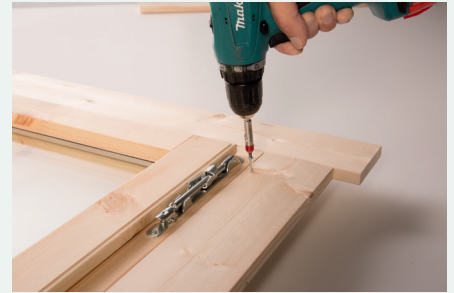
3. Anschrauben der Blenden