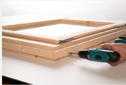
2. Anschrauben der Leisten