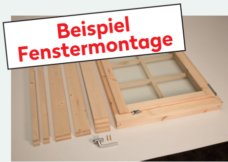
1. Einzelfenster mit Leisten, 8 Blenden und 1 Fenstergriff

Einzel- / Doppelfenster / Einzel- / Doppeltür