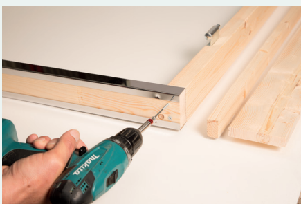
4. Anschrauben der unteren Türschwelle