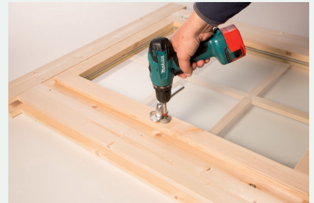
6. Anschrauben / Montage Fenstergriff