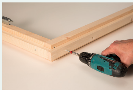
5. Leiste anschrauben