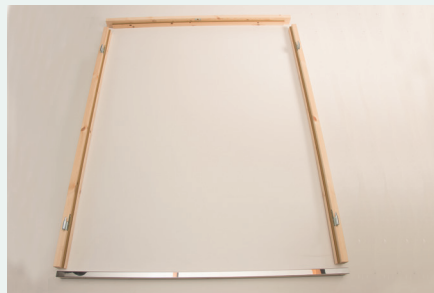
2. Positionieren der Rahmenteile