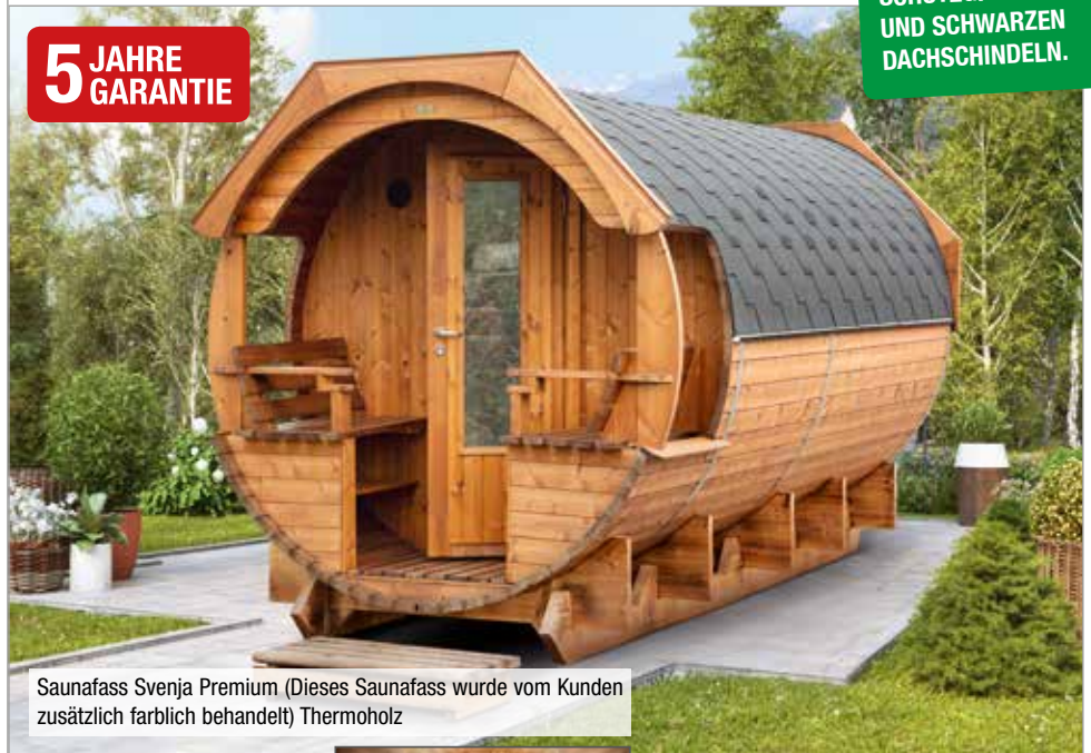
Saunafass Svenja Premium (Dieses Saunafass wurde vom Kunden zusätzlich farblich behandelt) Thermoholz