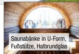
Saunabänke in U-Form, Fußstütze, Halbrundglas